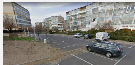
PARKING (AVENUE DES ELYSEES)