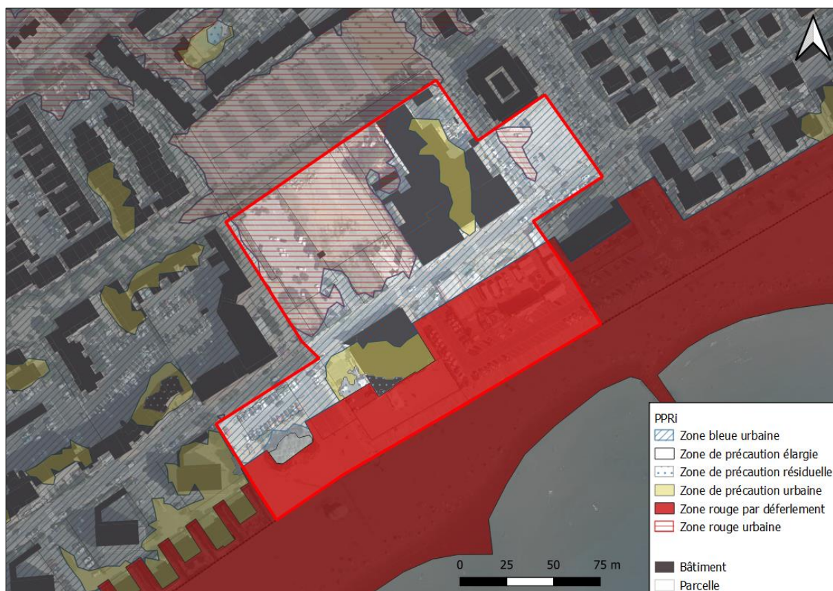
CARTE DU PPRi SUR LA ZONE DE L'OAP

La zone de l'OAP est elle aussi concernée par le risque inondation ainsi que le risque de déferlement, rendant les parties sud et nord-ouest du secteur inconstructible.