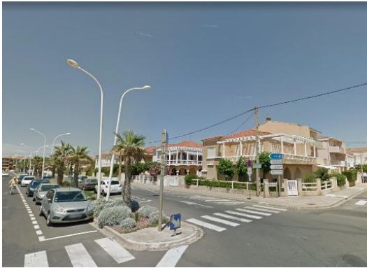
VUE SUR LA ZONE URBANISEE DEPUIS L'OAP

Le site est à proximité immédiate du front de mer, il s'insère entre la plage et la zone urbaine composé principalement d'habitat, collectif à l'ouest et plutôt individuel ou petit collectif à l'est. Une dune est également présente dans le secteur de l'OAP.