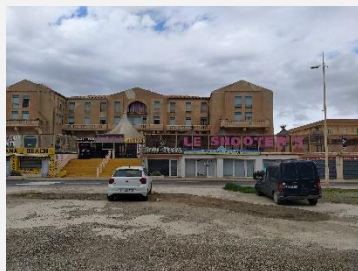
BATIMENT COMMERCE ET HABITAT (R+3)