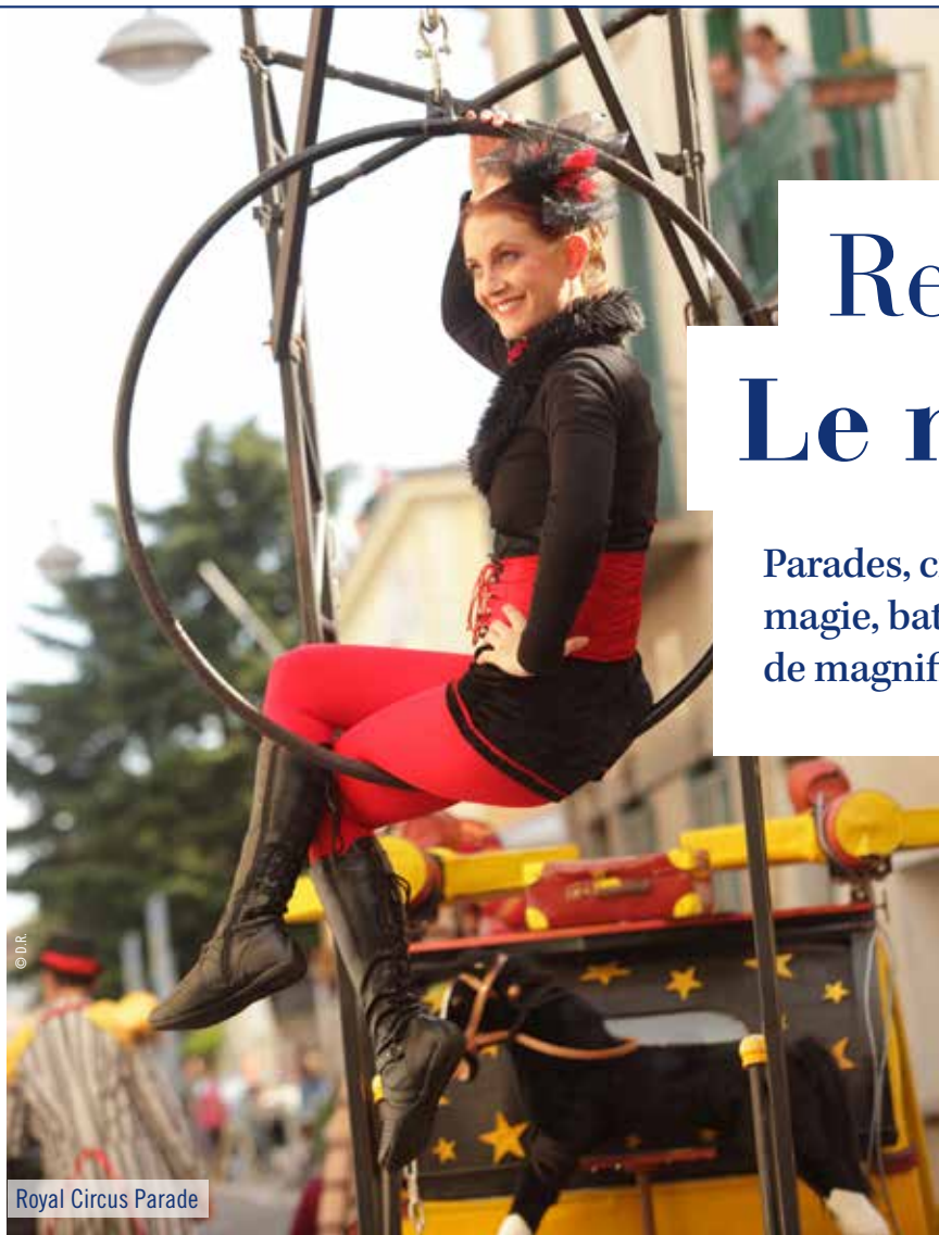
Royal Circus Parade

Parades, cirque, danse, musique, théâtre de rue, performance, fanfares, pyrotechnie, magie, batucadas... Plus de 50 spectacles et 300 artistes ! Tout au long de l'été, de magnifiques spectacles irrigueront la ville de Valras-Plage d'Est en Ouest.