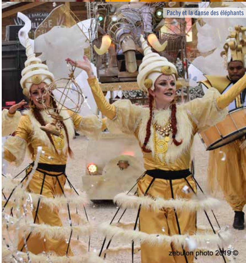
Pachy et la danse des éléphants