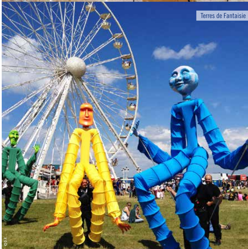
Terres de Fantaisie